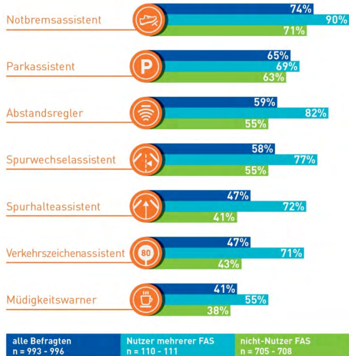
Diagramm: Attraktivität der Fahrerassistenzsysteme nach Fahrertypen